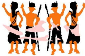
Aliansi Masyarakat Adat Nusantara